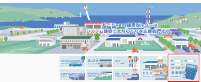
全国のビルダーの共同運営サイト 「yessビルダーズネット」

て迅速かつ正確な情報提供が可 能になっている。これもビルダ ーにとっては大きな利点だ。 この他、震災復興や東京五輪 による需要増でさらなる職人不 足が社会的に問題となる中で、 同社では発足当時から全国の協 力工事会社に働き掛けて「鉄 骨・板金エレクトラー制度」を確 立。人材の随時募集と教育を進 めてきた。このため同社には職 人不足問題は存在しない。シス テム建築の施工能力を身に付け た人材で施工し、常に高品質が 維持できる体制になっている。