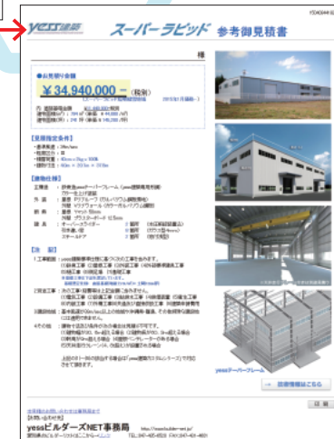
事業主は、幅・長さなどの簡単な入力で、 建物の参考価格を確認できる

エアはますます拡大していくも のと考えており、それに伴い、 ビルダー網の拡充やエレクトラー 制度の強化を図り、全国の事業 主さまのお役に立ちたいと考え ています」 同社の事業は、地域経済を活 性化するものであり、またそれ によって地域コミュニティの強 化に貢献しているといえる。